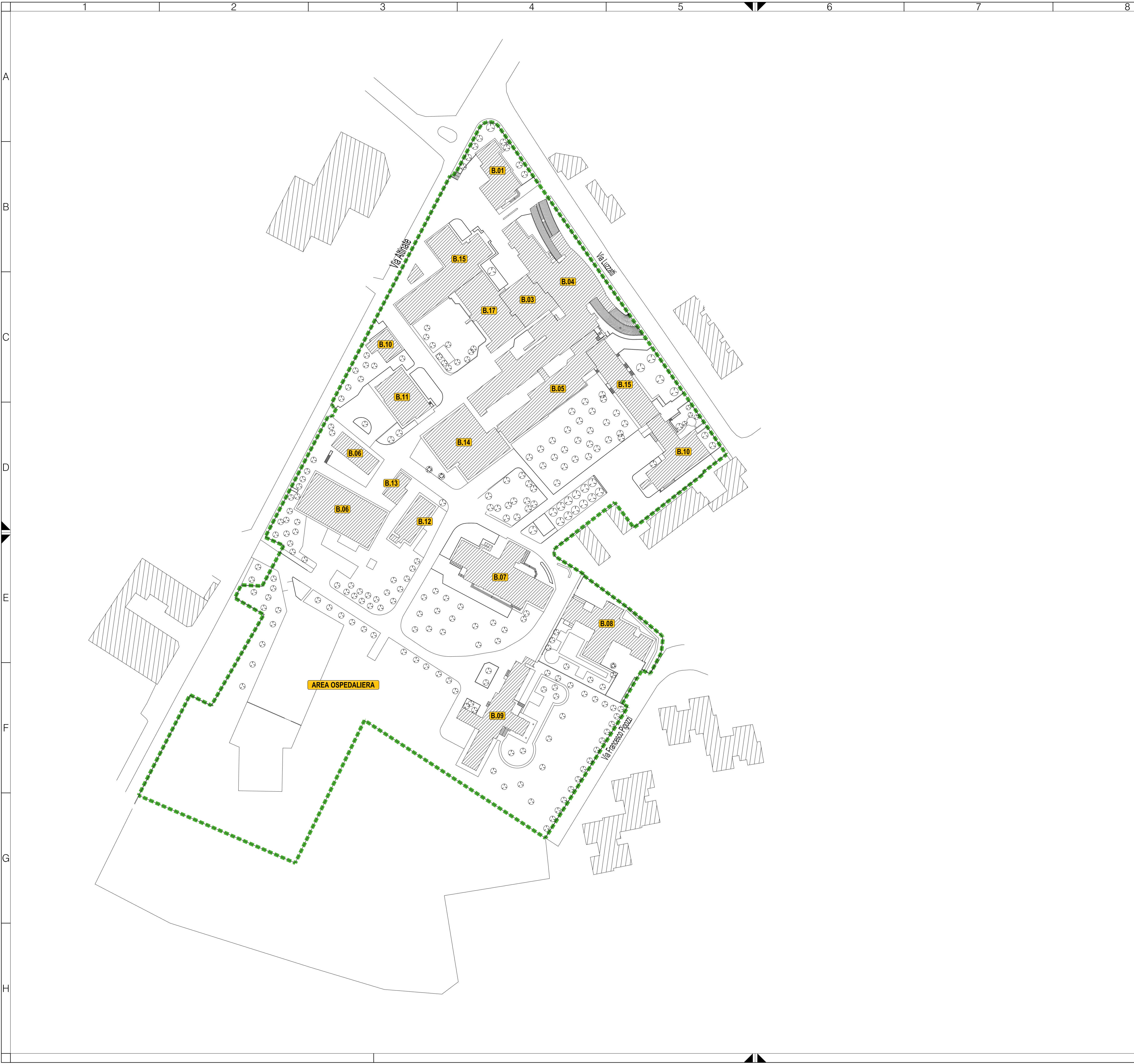
PLANIMETRIA GENERALE P.O. ODERZO scala 1:1000